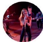
LIVE Para música en vivo