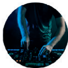
DJ Para uso general con Música grabada