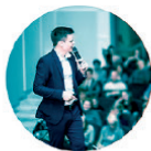
GALA Para acompañamiento musical y discursos